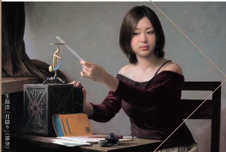
生島浩「月隠り」(部分)