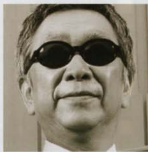
チチ松村 TITI MATSUMURA

1953年大阪生まれ。小学校6年生からギターを始める。ゴンチチ以外にもさまざまなアーティストのレコーディングやライブなどにゲスト参加している。また、CGやグラフィックデザインの分野でも独自の活動を展開。ゴンチチのアルバムジャケットのデザインも手掛けている。著書に『犬と暮らす人の生活/メディアファクトリー』がある。